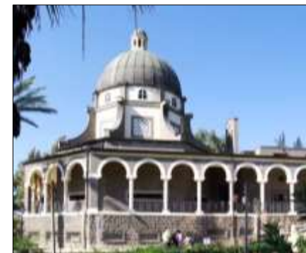
Hram Blaženstva izgrađen 1937 godine s osmerokutom kupolom.

Čitanje svetog Evanđelja po Luki: U ono vrijeme: Isus side s dvanaesticom i zaustavi se na ravnu. Podigne oči prema učenicima i govoraše: »Blago vama, siromasi: vaše je kraljevstvo Božje! Blago vama koji sada gladujete: vi ćete se nasititi! Blago vama koji sada plačete: vi ćete se smijati! Blago vama kad vas zamrže ljudi i kad vas izopće i pogrde te izbace ime vaše kao zločinačko zbog Sina Čovječjega! Radujte se u dan onaj i poskakujte: evo, plaća vaša velika je na nebu. Ta jednako su činili prorocima oci njihovi!« »Ali jao vama, bogataši: imate svoju utjehu! Jao vama koji ste sada siti: gladovati ćete! Jao vama koji se sada smijete: jadikovati ćete i plakati! Jao vama kad vas svi budu hvalili! Ta tako su činili lažnim prorocima oci njihovi.« Riječ Gospodnja (Lk 6,17.20-26).