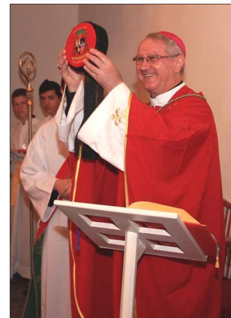
Krizma 12. lipnja 2016. u Svetištu Gospe od Čudesa