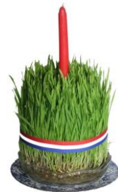
Gospić, 1. prosinca 2016.