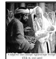
Vidješe oči moje spasenje tvoje. (Lk 2, 22-40)

Šimun i Ana susreću Gospodina koji dolazi u njihov život. Otvaraju mu se potpuno. I mi dolazimo, iz nedjelje u nedjelju. Danas smo posebno došli proslaviti blagdan susreta. Susrećemo li i mi Gospodina u našem životu. Jesmo li mu otvoreni? U ovom susretu susreću se i dva Zavjeta: stari, čiji su predstavnici Šimun i Ana, i Novi zavjet ustanovljen u Isusovoj krvi na križu. I starci prihvaćaju i prepoznaju Znak koji im se daje. I mi se susrećemo sa svakakvim novim idejama. I onim dobrima i plemenitima, ali i onim zlima i pokvarenima. Koliko smo pripravn i sposobni prepoznati i prihvatiti ZNAKOVE koje nosi naše vrijeme? Koliko mi vjera pomaže u onom što dolazi za bolji duhovni života? Ovdje se susreću ljudi: Šimun i Ana i Josip i Marija, a Isus je SVJETLO . I mi se susrećemo s ljudima. Koliko mi postajemo svjetlo za druge ljude? Koliko prihvaćamo svjetlo drugih ljudi da nas osvijetli, učini spremnima na ono sveto i veliko? Mnogo puta smo mogli biti drugima svjetlo. Nažalost, često smo, svojim ponašanjem, ugasili svjetlo u ljudima. Šimun i Ana su susretom bili RASVJETLJENI . Nastojmo mi drugima, životom i primjerom, svijetliti.